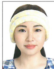
臉部及雙耳 被物品遮蔽