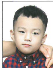
非獨照·出現 其他人、物影像