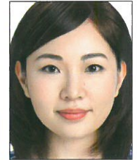
頭部過大· 頭髮碰觸邊框