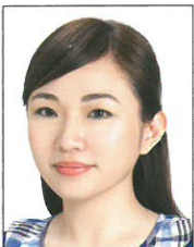
頭部側向一邊、 未正視鏡頭