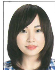
頭髮遮蔽到 眼睛或耳朵