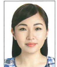
使用有色 隱形眼鏡